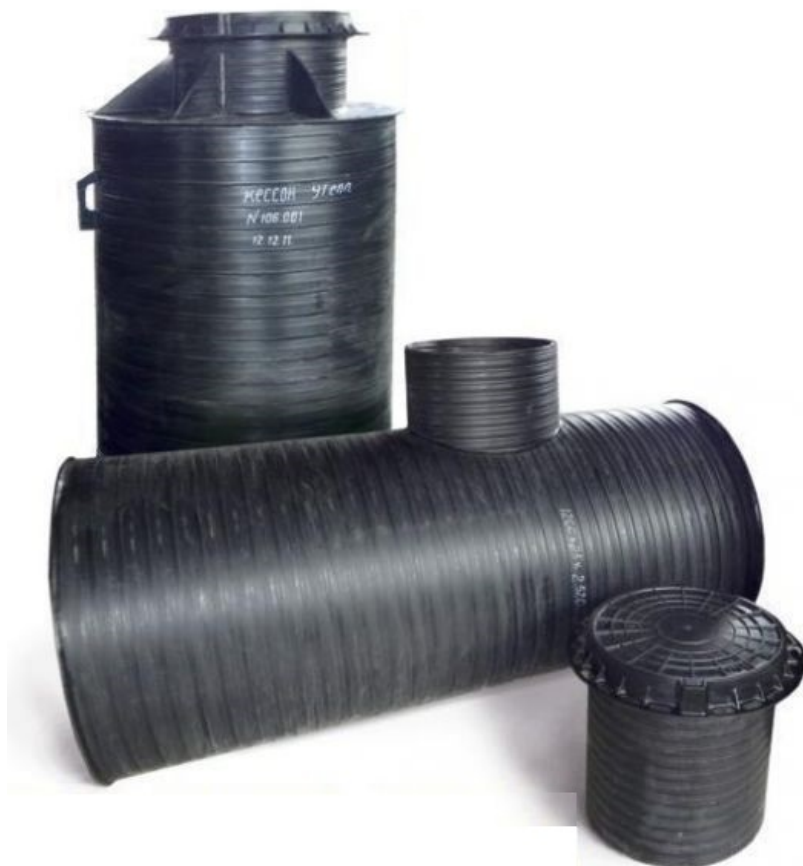
Рисунок 4.1 – Пластиковый накопитель

Перечень основных мероприятий по улучшению существующего положения в сфере водоотведения в Гонжинском сельсовете предлагаемые схемой водоснабжения и водоотведения на период 2018-2028 годы приведен в таблице 4.1.