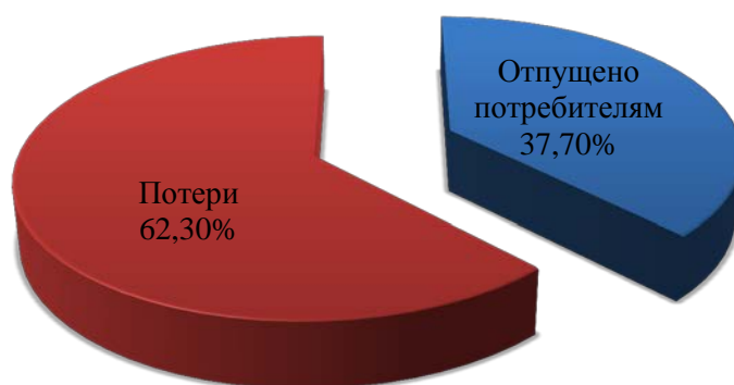
Рисунок 3.1 –Баланс водоснабжения с. Гонжа